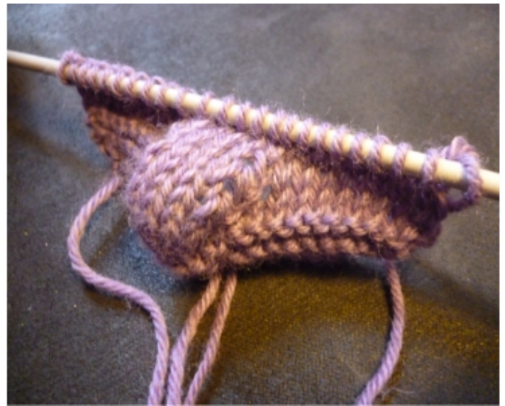
rg 20 terminé

rg 13 : 10m en attente, 2m ens, 5m centrales, 11m en attente